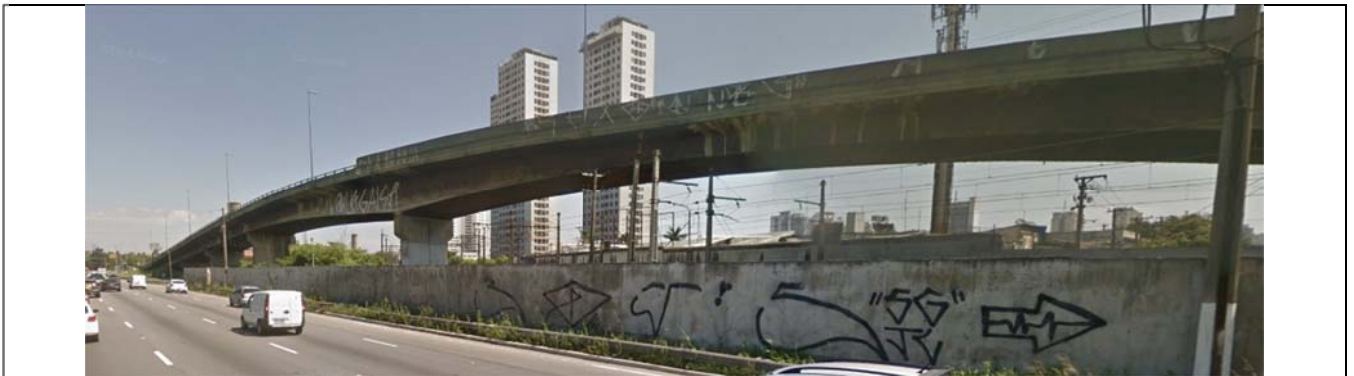
Viaduto Lazlo Braun visto da Marginal Pinheiros